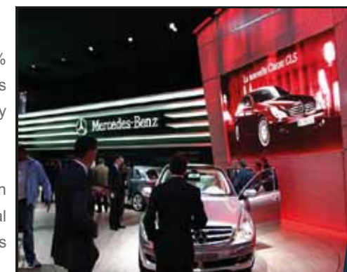
Pantalla Electrónica LED para Interior