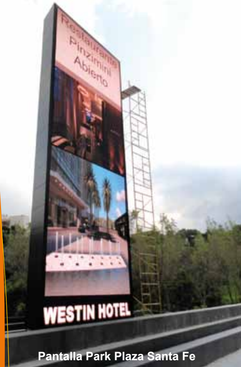
Pantalla Park Plaza Santa Fe