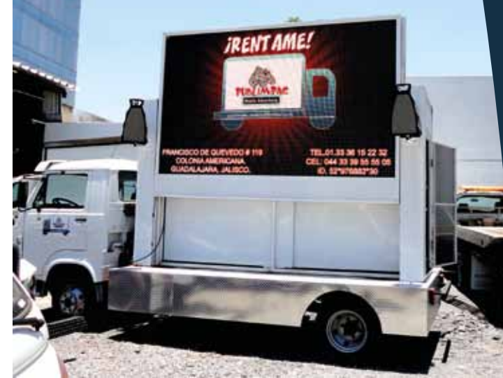
Pantalla Publicitaria de LED tipo Móvil

Para mayor información acerca la renta de nuestras pantallas comuníquese con uno de nuestros ejecutivos.